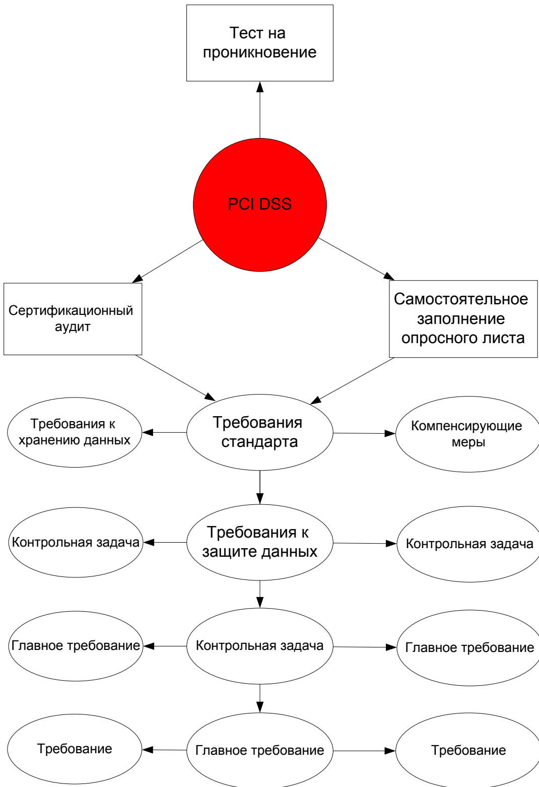
Рис. 1. Структура стандарта PCI DSS